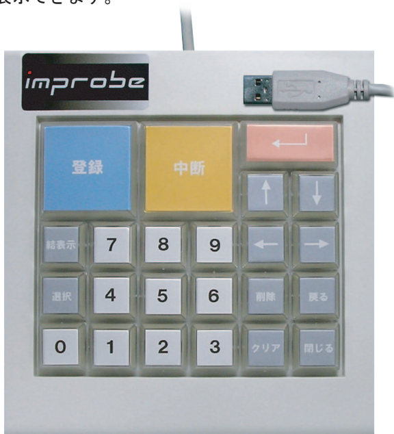
簡易キーボード (日常防水タイプ)